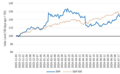
IBM vs S&P 500 (180 days)