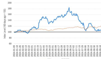
MU vs S&P 500 (180 days)