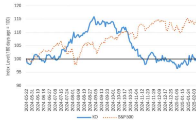
KO vs S&P 500 (180 days)